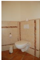
Das WC im großen Badezimmer, gut versteckt zwischen Tür und Sauna