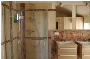
Das Bad aus einem anderen Blickwinkel: die großzügige Dusche