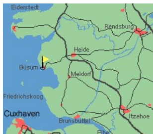
Entfernungen, zirka: zum Bäcker 400m, zum Einkaufsladen 400m, zum Badestrand 500m, zum Ortszentrum 350m